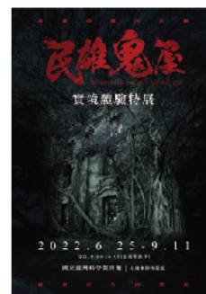
民雄鬼屋實境體驗特展