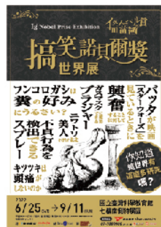
搞笑諾貝爾獎世界展